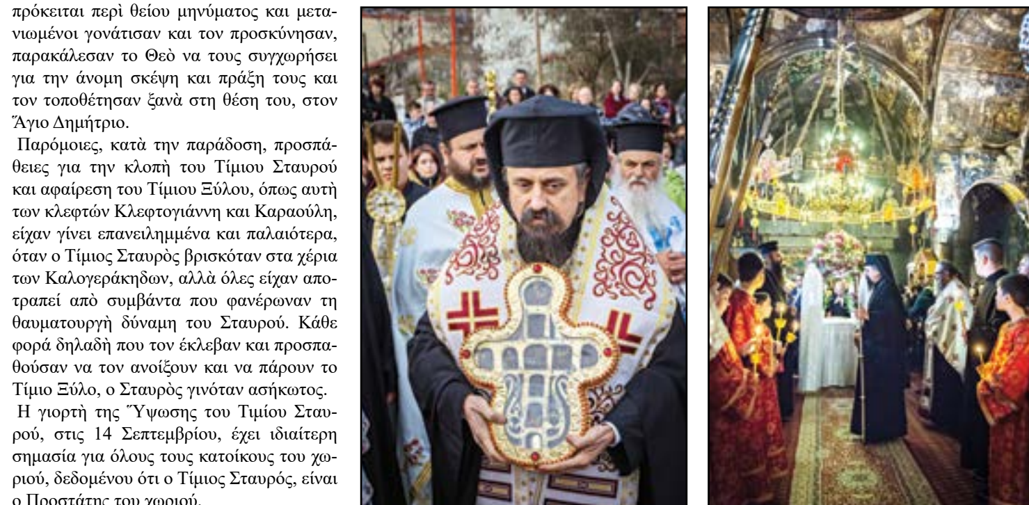
ναύ της Γέννησης του Σωτήρος, που υπήρξε πολύ παλιά στο Τροβάτο και στη θέση του οποίου στις μέρες μας ο παπα-Πέτρος Νταλλής, με τη βοήθεια των Τροβατιανών, έχτισε καινούριο εκκλησάκι του Σωτήρος, το 1990. Κανείς, βέβαια, δεν ξέρει ακριβώς πώς ο Τίμιος Σταυρός έφτασε στα χέρια του ευσεβούς Δρούγκα, ο οποίος, το 1615 τον αφιέρωσε στον Άγιο Δημήτριο. Μεταξύ των άλλων πιστευόταν και πιστεύεται ότι με τη βοήθεια του Τιμίου Σταυρού θεραπεύονταν άτομα από βαριές ασθένειες και ειδικότερα άτομα που έπασχαν από ψυχικές ασθένειες. Πιστεύεται ότι ο επαργυρωμένος ξυλόγλυπτος Σταυρός εμπεριέχει ενσωματωμένο μικρό τμήμα από το «τίμιο ξύλο», δηλαδή από το ξύλο του Σταυρού πάνω στον οποίο μαρτύρησε ο Χριστός, και ότι όποιος μπορεί να έχει, έστω και ένα «αγκιδάκι», δηλαδή ένα ελάχιστο τμήμα του «τίμιου» αυτού «ξύλου», προστατεύεται από οποιοδήποτε κακό, ακόμη και από σφαίρα.

Αυτό έχοντας υπόψη τους κάποτε κλέφτες της περιοχής, έκλεψαν ένα βράδυ τον Τίμιο Σταυρό. Πήγαν πιο πέρα και κοιμήθηκαν με σκοπό το πρωί που θα ξυπνούσαν, να βγάλαν το «τίμιο ξύλο», να έπαιρναν από ένα μικρό κομματάκι και έτσι να μην κινδυνεύουν να σκοτωθούν από εχθρικό βόλι. Τα χαράματα ξύπησαν και θέλησαν να φύγουν, όταν όμως προσπάθησαν να σηκώσουν και να πάρουν μαζί τους τον Τίμιο Σταυρό, διαπίστωσαν ότι αυτός ήταν τόσο βαρύν που δεν μπορούσαν όλοι μαζί να τον μετακινήσουν από τη θέση του. Τότε κατάλαβαν ότι πρόκειται περί θείου μνημόματος και μετανιωμένοι γονάτισαν και τον προσκύνησαν, παρακάλεσαν το Θεό να τους συγχωρήσει για την άνομη σκέψη και πράξη τους και τον τοποθέτησαν ξανά στη θέση του, στον Άγιο Δημήτριο.