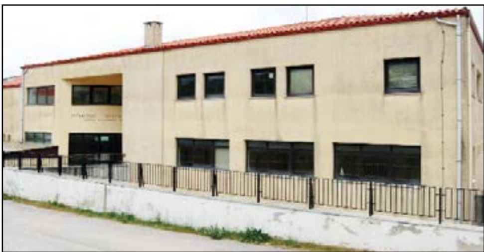
έως τη λήξη του Προγράμματος.

Στη σύναψη Συμβάσεων Εργασίας ΟΡΙΣΜΕΝΟΥ ΧΡΟΝΟΥ στο πλαίσιο του ΕΠΙΧΕΙΡΗΣΙΑΚΟΥ ΠΡΟΓΡΑΜΜΑΤΟΣ «ΣΤΕΡΕΑ ΕΛΛΑΔΑ 2014 - 2020», ΑΞΟΝΑΣ ΠΡΟΤΕΡΑΙΟΤΗΤΑΣ 10 «ΠΡΟΩΘΗΣΗ ΤΗΣ ΚΟΙΝΩΝΙΚΗΣ ΕΝΤΑΞΗΣ ΚΑΙ ΚΑΤΑΠΟΛΕΜΗΣΗ ΤΗΣ ΦΤΩΧΕΙΑΣ -ΕΚΤ» ΣΥΓΧΡΗΜΑΤΟΔΟΤΟΥΜΕΝΟΣ ΑΠΟ ΤΟ ΕΥΡΩΠΑΪΚΟ ΚΟΙΝΩΝΙΚΟ ΤΑΜΕΙΟ, προχωρά ο Δήμος Καρπενησίου για τα «Κέντρα Κοινότητας» και για τη «Δομή Παροχής Βασικών Αγαθών: Κοινωνικό Παντοπωλείο, Παροχή Συσσιτίου, Κοινωνικό Φαρμακείο».