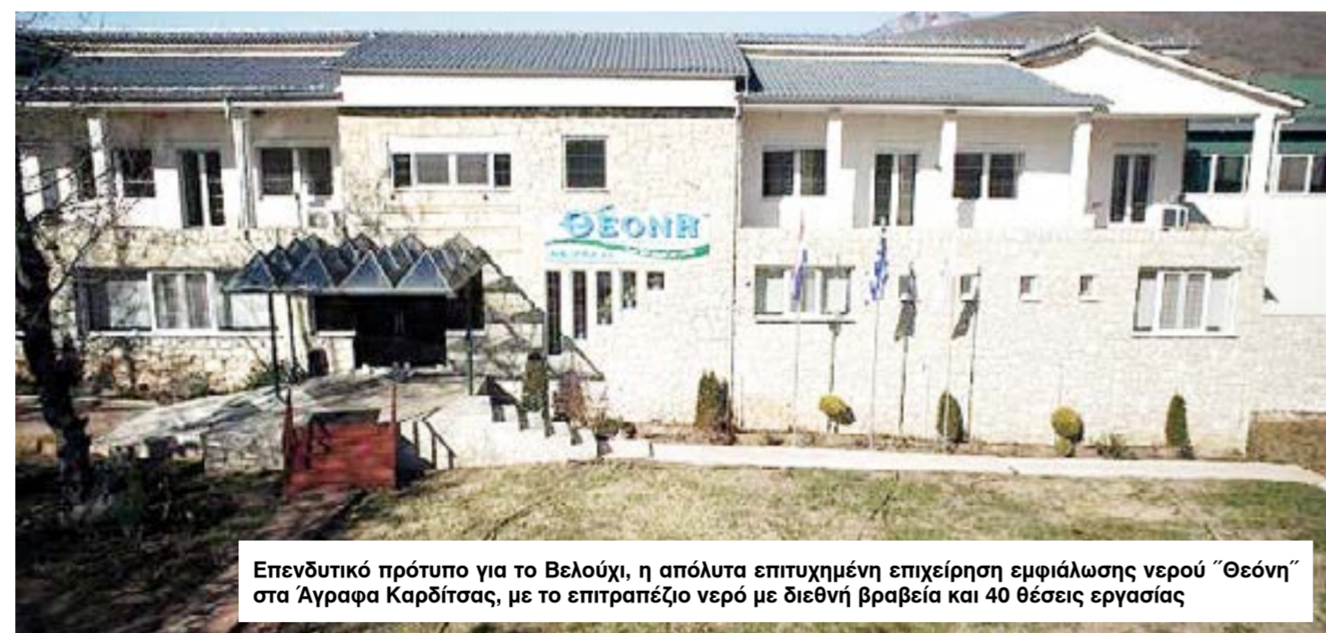
Επενδυτικό πρότυπο για το Βελούχι, η απόλυτα επιτυχημένη επιχείρηση εμφιαλώσεως νερού "Θεόνη" στα Αγραφα Καρδίτσας, με το επιτραπέζιο νερό με διεθνή βραβεία και 40 θέσεις εργασίας

Η μέχρι πρότινος ανεκμετάλλευτη και εγκαταλελειμμένη πηγή «Μεσαίο Κεφαλόβρυσο» στην Περιοχή Αγίας Τριάδας της Δημοτικής Ενότητας Κτημενίων, πρόκειται σύμφωνα με τις προσδοκίες του Δήμου Καρπενησίου να προσελκύσει μεγάλο επενδυτικό ενδιαφέρον αφού μπορεί να αποδώσει ικανοποιητικά αποτελέσματα. Μετά από αρκετά χρόνια προσπάθειών του Δήμου Καρπενησίου να περάσει η διαχείριση της πηγής πάλι πίσω στον Δήμο, ύστερα από την αποτυχημένη επένδυση του προηγούμενου κατόχου που είχε σύμβαση μέχρι το 2020, τελικά φαίνεται ότι έρχεται η λύση. Η σχετική απόφαση ψηφίστηκε ομόφωνα στις 16 Νοεμβρίου από το Δημοτικό Συμβούλιο και στόχος της Δημοτικής Αρχής είναι η εκμετάλλευση της