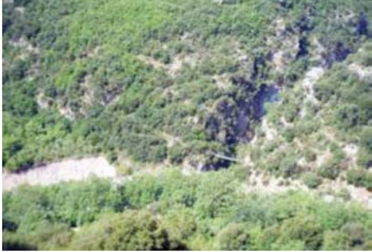
Σε πρώτο πλάνο το πλατανόδασος όπου θα δημιουργηθεί ο χώρος αναψυχής και στη συνέχεια το φαράγγι Πανταβρέχει με την κρεμαστή γέφυρα στην είσοδο του φαραγγιού

Μπακογιάννη, να ανακοινώσουμε την χρηματοδότηση του έργου «ΑΝΑΠΛΑΣΗ ΠΕΡΙΒΑΛΛΟΝΤΟΣ ΧΩΡΟΥ ΣΤΗΝ ΠΕΡΙΟΧΗ « ΠΑΝΤΑΒΡΕΧΕΙ» συνολικού προϋπολογισμού 240.000,00 €. Το έργο περιλαμβάνει ήπιες παρεμβάσεις προς κατασκευή, για διευκολύνσεις στους επισκέπτες, και είναι τέτοιες ώστε αφ' ενός να διατηρείται η ποιότητα του φυσικού περιβάλλοντος και αφ' ετέρου δε να παρέχονται οι στοιχειώδεις ανέσεις στους επισκέπτες του χώρου. Αποτελεί βαθιά μας πίστη ότι η δημιουργία υποδομών εναλλακτικού τουρισμού στην περιοχή αποτελεί την βάση για τον εμπλουτισμό του τουριστικού μας προϊόντος και την ανάπτυξη του τουριστικού μας τομέα, ο οποίοςς δημιουργεί τόσο άμεσες όσο και έμμεσες θέσεις εργασίας».